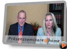
Präsenzseminare @ home Ihr Weg zum Erfolg: Das atheus-Lernsystem

atheus informiert Sie fair und kompetent