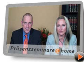
Präsenzseminare @ home Ihr Weg zum Erfolg: Das atheus-Lernsystem

atheus informiert Sie fair und kompetent